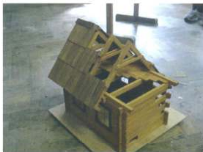
Maketa tradicijske kuće

U prezentaciji su sudjelovali učenici stukovnih škola iz Zagreba, Karlovca, Rijeke, Delnica, Virovitice, Čakovca, Novske, Vinkovaca, Požege, Siska, Splita, Ogulina i Nove Gradiške.