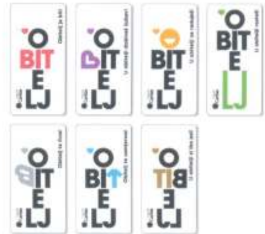
Magneti s porukama

U akciji su sudjelovali svi učenici i nastavnici Škole. Bila je to prilika ispružiti ruku prijateljstva i ljubavi, te pokazati zajedništvo i solidarnost.