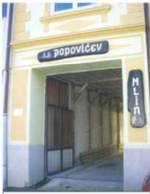
Ulaz u mlin

Povodom obilježavanja Dana kruha, 22. listopada 2010. posjetili smo Popovićeve mlin u Delnicama.