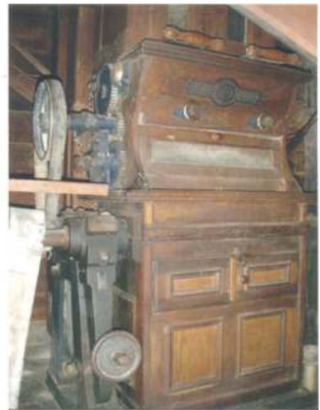
Stari mlin na struju

Izgradnja električnog mlina započela je 1924. godine. Uz pomoć nekolicine mještana Delnica, gradila su ga i dvojica majstora iz Austrije. U objekt mlina ugrađeni su dijelovi mlina tvrtke „Ganz Danubius“ iz Budimpešte koja i danas radi, ali u sektoru brodogradnje.