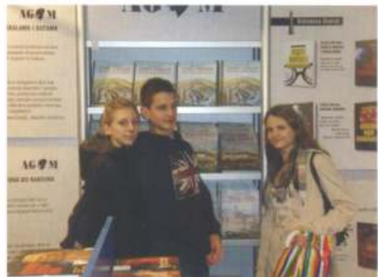
Naši učenici na Interliberu

Na sajmu knjiga bili smo u mogućnosti razgledavati i kupovati knjige po iznimno niskim cijenama. Osim izlagača knjiga sajmu su prisustvovali i razni pisci te književni kritičari.