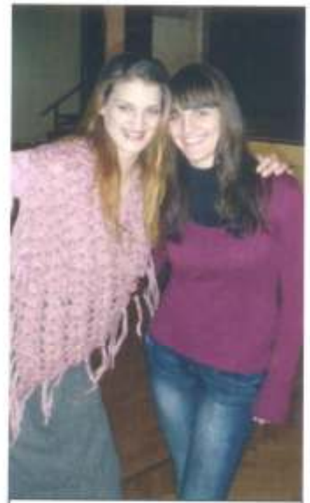
Glumica i novinarka

I na kraju našeg razgovora zahvalili smo se i poželjeli glumici sreću u daljnjem radu na što nam je ona odgovorila kako je jako zadovoljno našom interesom i zanimanjem za predstavu i kako bi joj bilo jako drago da se ponovo vidimo.