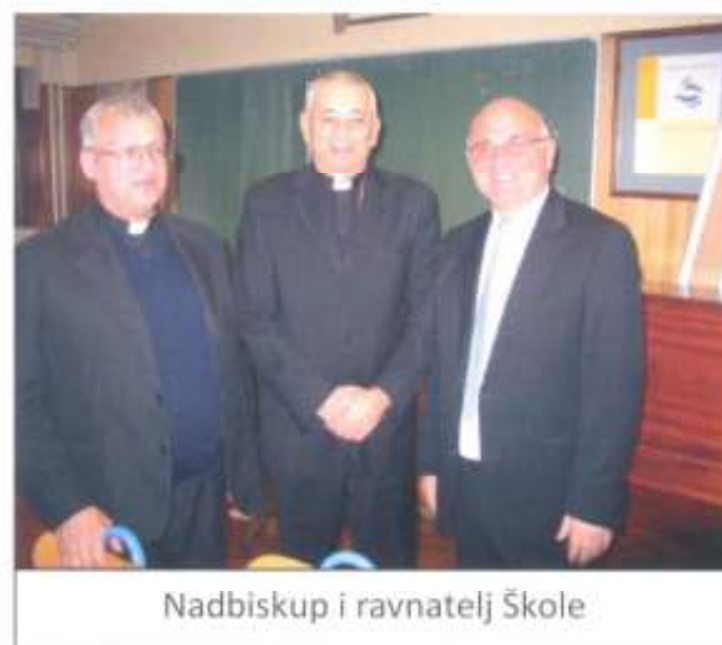
Nadbiskup i ravnatelj Škole

Nakon kratkog susreta, nadbiskup se zahvalio i zbog obaveza oprostio od nazočnih.